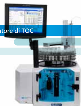
Analizzatore di TOC