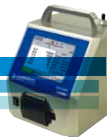
Contatore di particelle aria