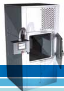
Pass Box a perossido di idrogeno