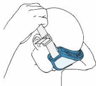
Fig.1 - Calzare la maschera

NESSUN COMPONENTE AGGIUNTIVO TENUTA DELL'ELASTICO SCORREVOLEZZA ANTISTATICITA' REGOLAZIONE CON GUANTI STABILITA' DEL CURSORE