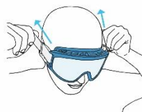
Fig.2 - Regolare la lunghezza dell'elastico tirando delicatamente all'indietro le estremità